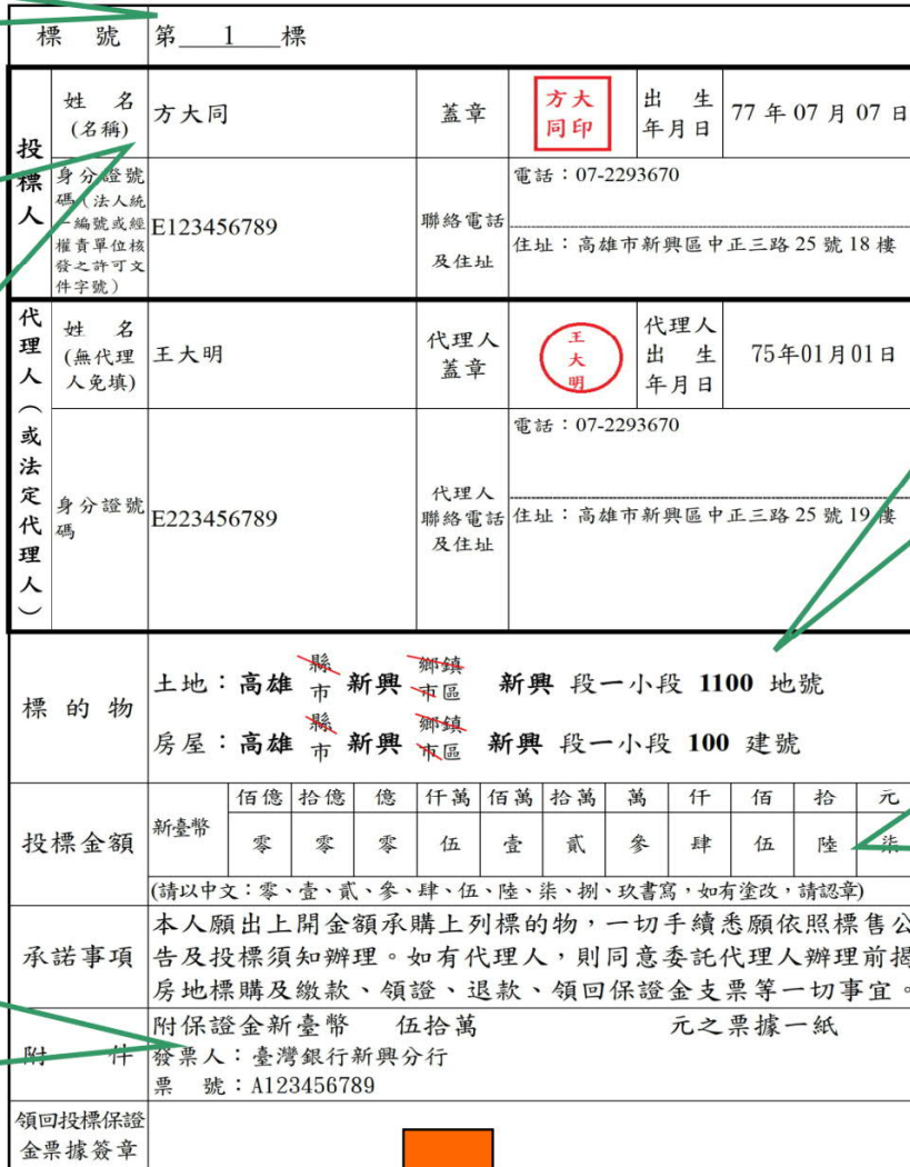
財政部國有財產署南區分署標售國有不動產投標單

請檢查投標人及代理人資料是否正確。投標人有多人時要註明持分。例如：方大同 1/2 方小同 1/2